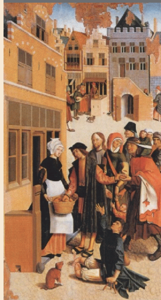
Maestro di Alkmaar (XVI sec.) "Dar da mangiare agli affamati"